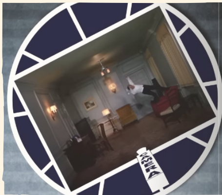
« DANCE CEILING » DE FRED ASTAIRE