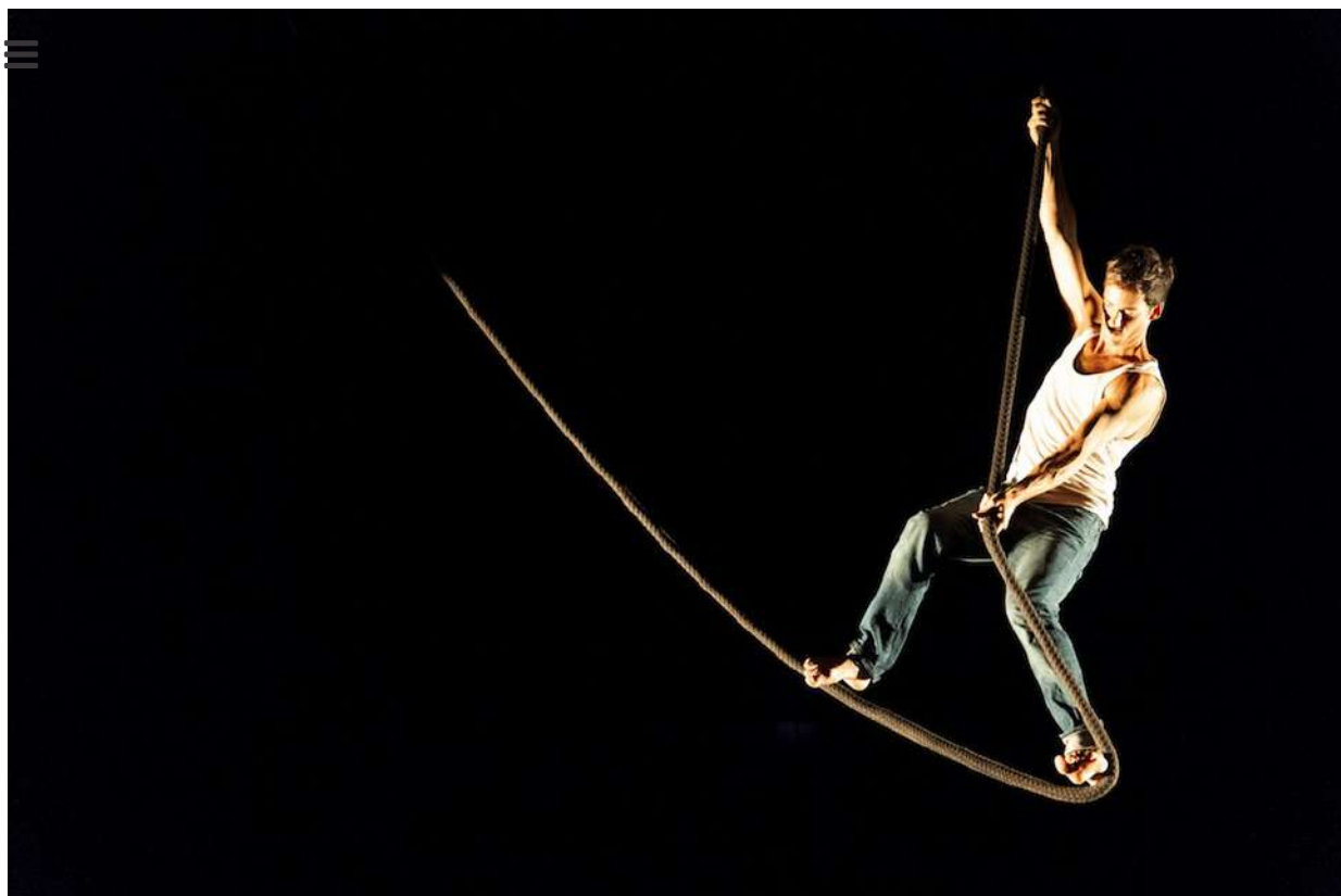
« Interprète », de Cheptel Aleïkoum © Ian Grandjean

En définitive, dans son inventaire à la Prévert, Maxime Mestre, petit cancre, répond donc « non » aux maîtres. Mais, si les visages colorés du Cheptel apparaissent sur un tableau, sa brebis noire, n’efface pas pour autant le tableau de nos malheurs. Un spectacle intelligent mais âpre.