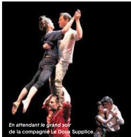
En attendant le grand soir de la compagnie Le Doux Supplice.

voltigeur mêle au cirque une part de chorégraphie. Avec danseurs et circassiens, il fait de la piste un espace de rencontre entre les disciplines, et entre les spectateurs et les artistes. Car si ces derniers entament entre eux un bal ponctué par des figures virtuoses, par des chorégraphies à couper le souffle, ils ont l'art d'inviter tout le monde à les rejoindre. Nourris par leur pratique de « bals sauvages » – « moments imprévus et impromptus dans l'espace public », expliquent-ils – durant tout le processus de création, ils savent mêler leur grande technique à leurs fragilités pour transformer le spectacle en une expérience collective. En une douce et vertigineuse introduc-